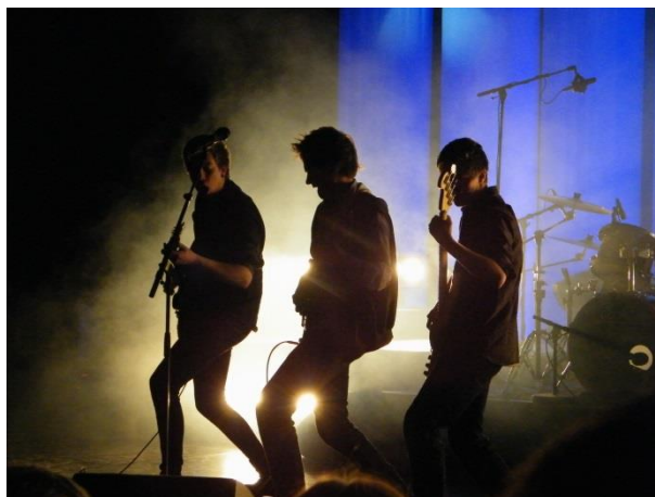
Rockebandet No Resistance . UKM 2013.

Rogaland fylkeskommune vil ta tak i dette og arrangera ein konferanse for dei ansvarlege for UKM, DKS og kulturskulane i Rogaland.