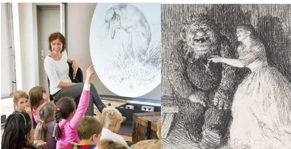
Eventyrskatten. Visuell kunst. 1. – 4. trinn

Informasjon skal vera tilpassa målgruppa i form og innhald. Informasjonen skal som alt anna vera prega av høg kompetanse og kvalitet.