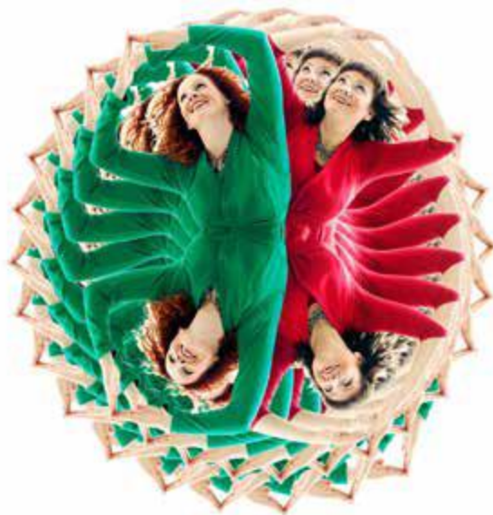
Husene på Bronselurberget. Konsert. Barnehage.

Fylkeskommunen stiller med same sum som Rikskonsertane til barnehagekonsertane. I dag er det 200 000 kroner per år.