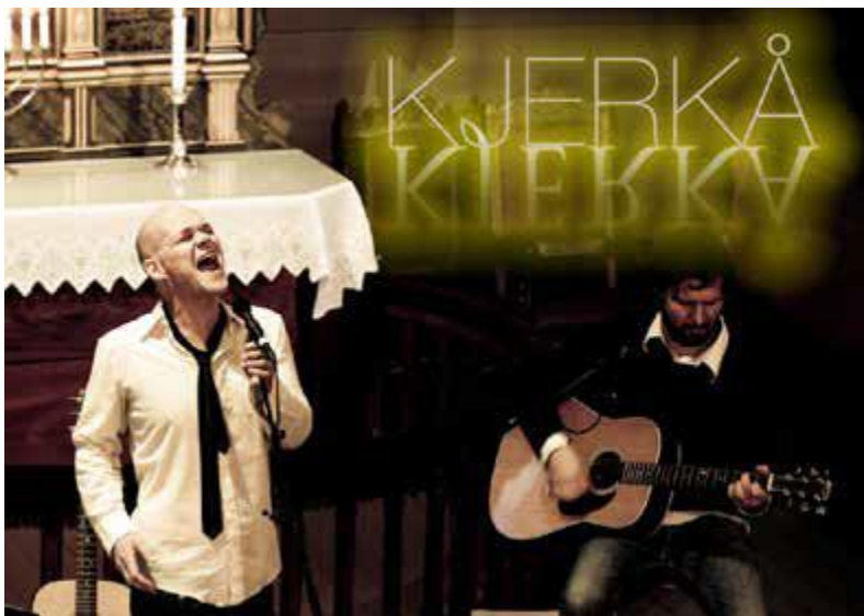
Kjerkå. Musikk. 8. – 10. trinn.

DKS Rogaland ønskjer gjennom oppdrag i Den kulturelle skulesekken å stimulera utøvarar i regionen, dersom kvaliteten er god og form/innhald dekkjer behova frå DKS.