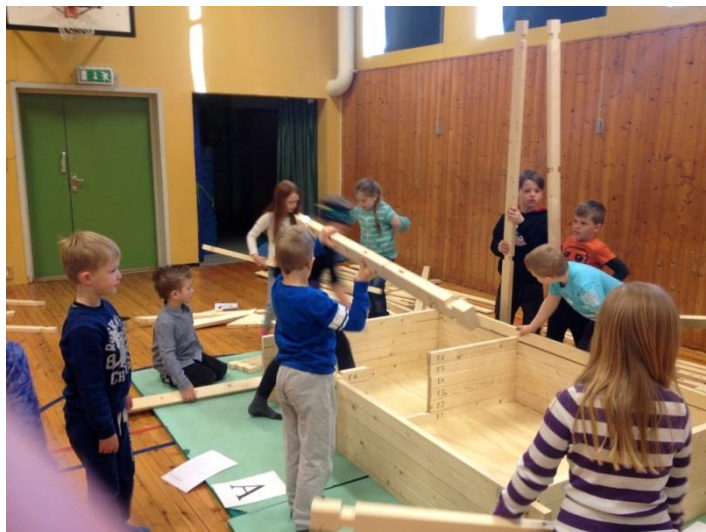
Hus må me ha... Kulturarv. 1. – 7. trinn.

Det samla driftsbudsjettet (det som ikkje kan takast av spelemidlane) er på kr. 746 000,-. Dette skal dekkja informasjon (KSYS-systemet og katalog), kulturorg og seminar for grunnskular, vidaregåande skular og kommunar. Reiser, telefon, kompetanseheving og møteverksemd for DKS-gruppa. Summen vart ikkje auka ved innføring av DKS i vidaregåande skule.