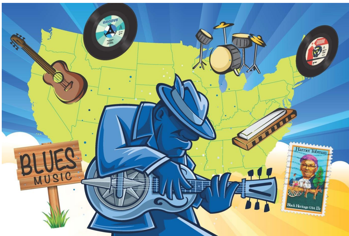
Blues for barna. Skulekonsert. 1. – 7. trinn.