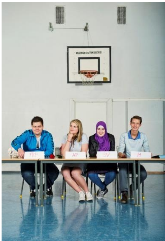
Til Ungdommen. Film. Vidaregåande skule.

Planen skal tena som grunnlag for andre fylkeskommunale planar og vera eit internt styringsdokument.