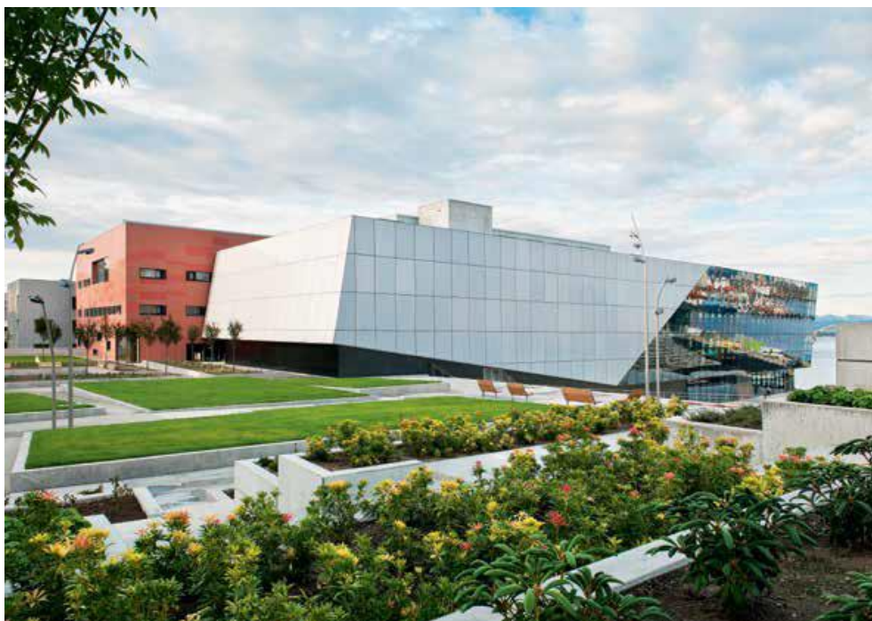
Klassisk musikk og samtidsmusikk. 5. – 7. trinn

Rogaland fylkeskommune vil satsa på å gje ein produksjon i året, hovudsakleg i form av ein konsert, til alle lærarstudentar i Rogaland. Med konserten vil vi også informera om DKS/Rikskonsertane som del av innhaldet i skulen.