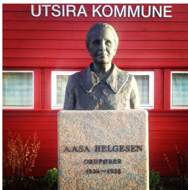
Kvinnekuppet. Kunststartar i samspel. 8. – 10. trinn.

Når det gjeld lokal forankring, har desse treffpunkta vore del av denne strategien. Også her har vi fått svært positive tilbakemeldingar. Det er likevel ei utfordring her, og det gjeld stort sett små kommunar og utkantskommunar: Dei som arbeider med DKS i små kommunar, har ofte ei rekkje arbeidsområde. Dette gjer at dei ikkje kan prioritera å koma på samlingar og andre kompetansehevande tilbod. Utkantskommunane slit med lang reiseveg, stor avstand mellom skulane og større utgifter enn meir sentrale kommunar.