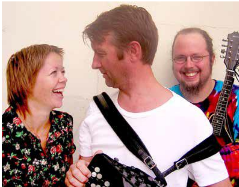
Skakke sanger. Skulekonsert. 1. – 4. trinn.

(Boka «Den kulturelle skolesekken», utgitt av Kulturrådet i 2013 har ei brei omtale av rapporten og resultatata frå Rogaland.)