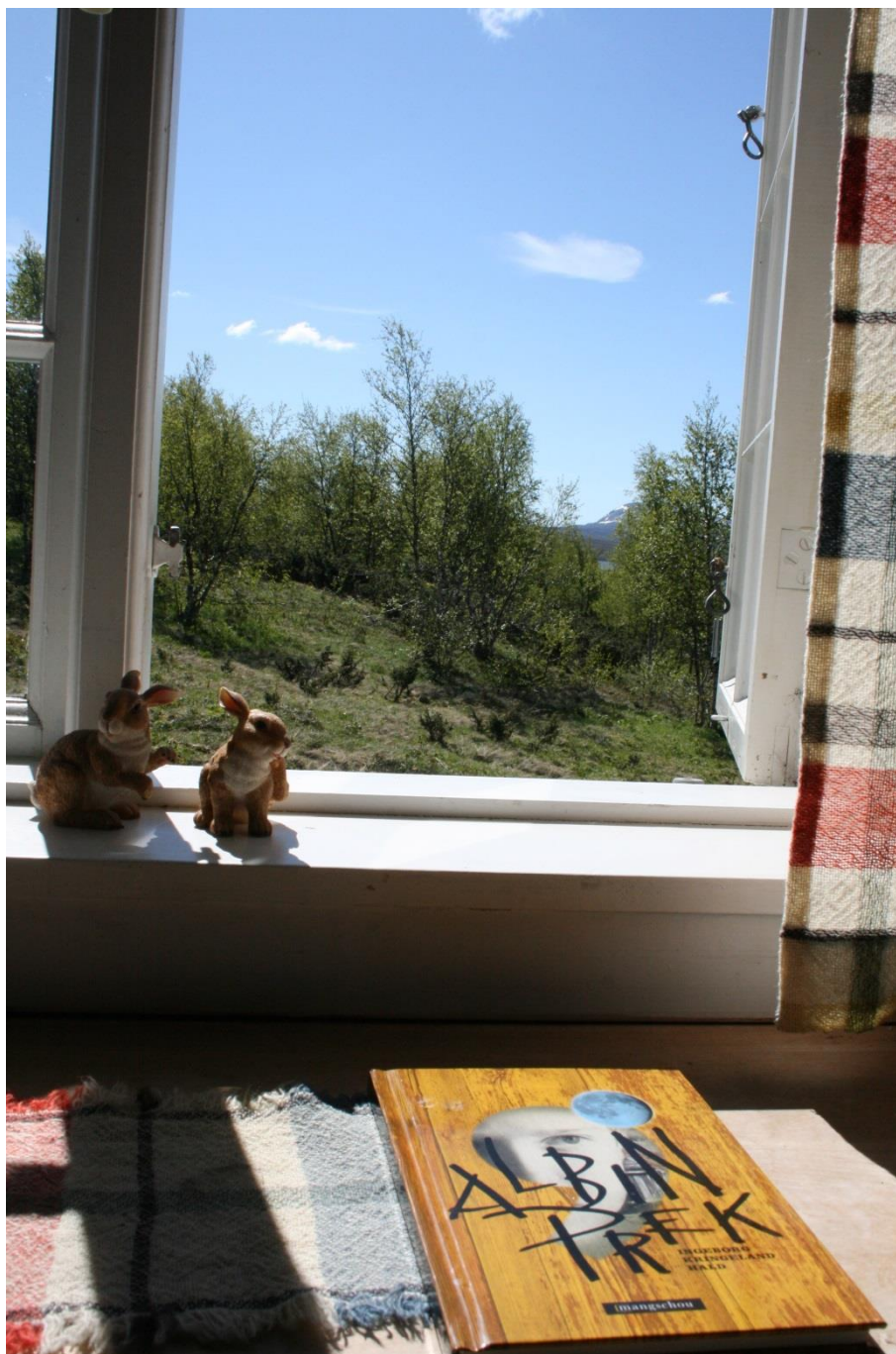
Albin Prek. Litteratur. 5. – 7. trinn.

Kulturutredninga sitt fokus på barn og unges perspektiv må takast alvorleg, og modellar for elevdeltaking og tilbakemeldingar må utviklast.