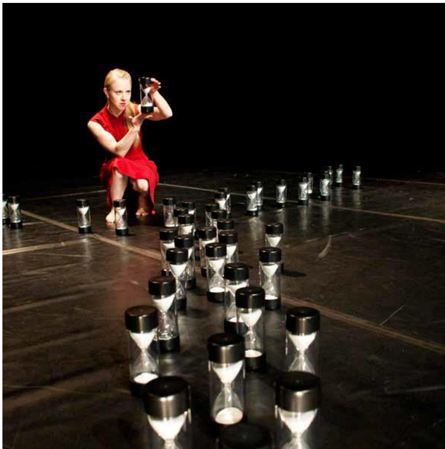
I wish her well. Scenekunst. 8. – 10. trinn.